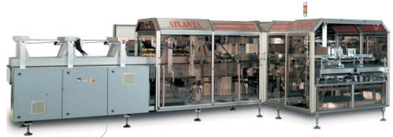
Versione base. - Basic version.