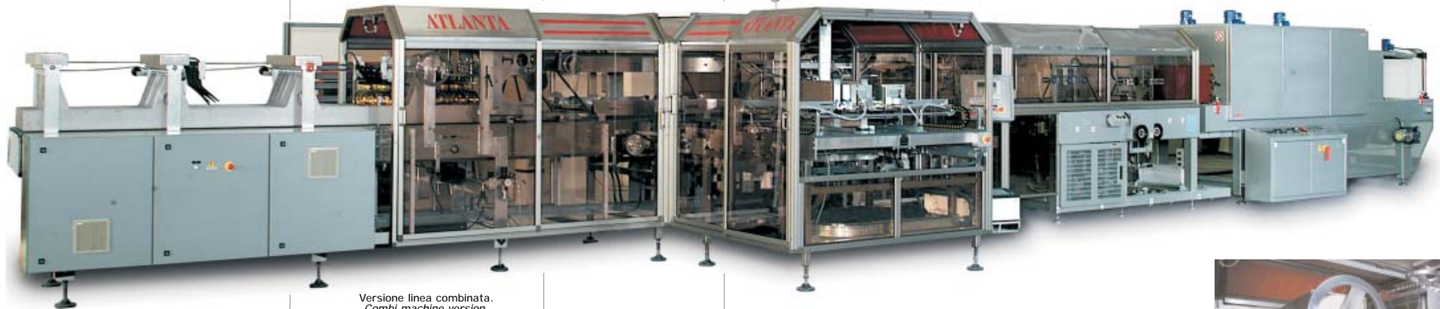
Versione linea combinata. Combi machine version.