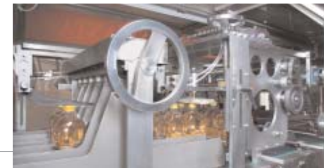
Separatore a geometria variabile. Variable size conveyer.